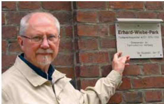
Die Grünfläche hinter dem Schumacher-Bau am Berliner Tor 21 wurde 1997 Erhard-Wiebe-Park getauft.