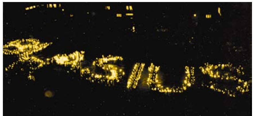
Fackelzug anlässlich des 50. Dienstjubiläums von Blasius

Die zu diesen beiden Bereichen gehörenden Lösungen werden im Übergangsbereich geeignet aneinander angepasst. Dieser Ansatz bildete den Schlüssel für ein Weiterkommen in der Frage der Turbulenz. Während Prandtl damals keine direkte Anwendung seines Ansatzes angab, gelang es seinem ersten Doktoranden Heinrich Blasius, die Bedeutung der neuen Formulierung zu umreißen.